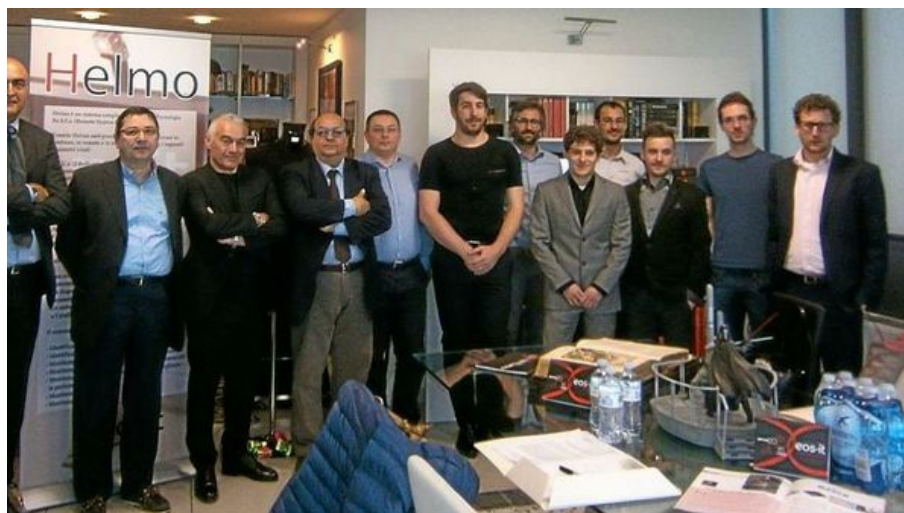
Una fase della presentazione di Helmo, l'innovativa t-shirt firmata dalla Xeos.it di Roncadelle

Una t-shirt attrezzata con sensori per monitorare lo stato di salute e in grado di far scattare l'allarme. Il sistema si può personalizzare